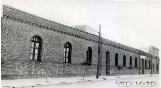
Colegio San Antonio en calle Brasil, hoy Rucci.